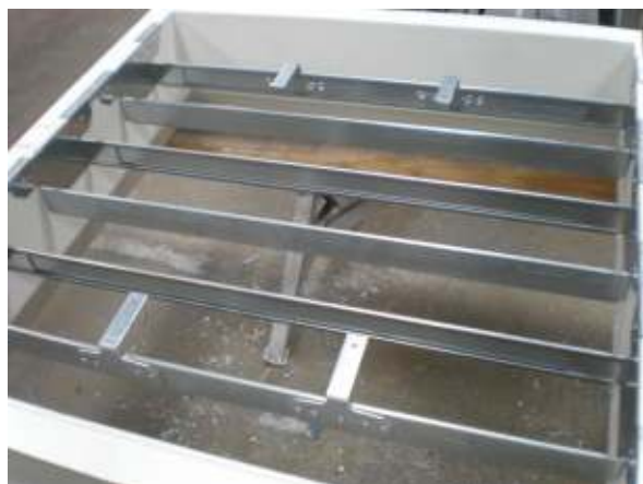
4. Bausätze in Kranz einsetzen