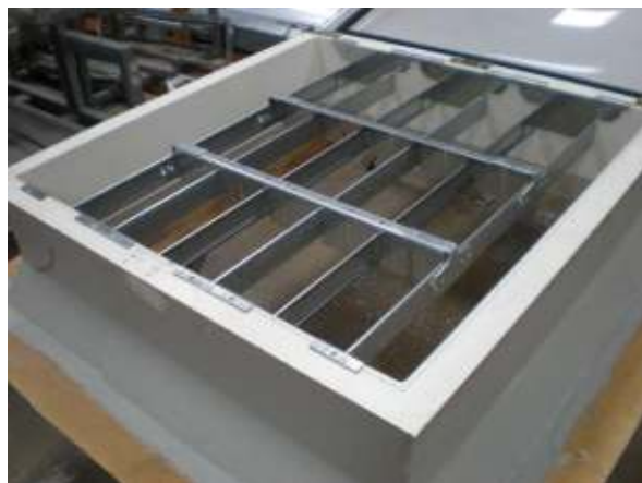
6. Kammspange mit Kammspangenwinkel vernieten