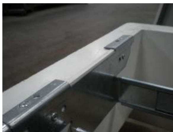
5. Seitenblech mit Kranz verbieten