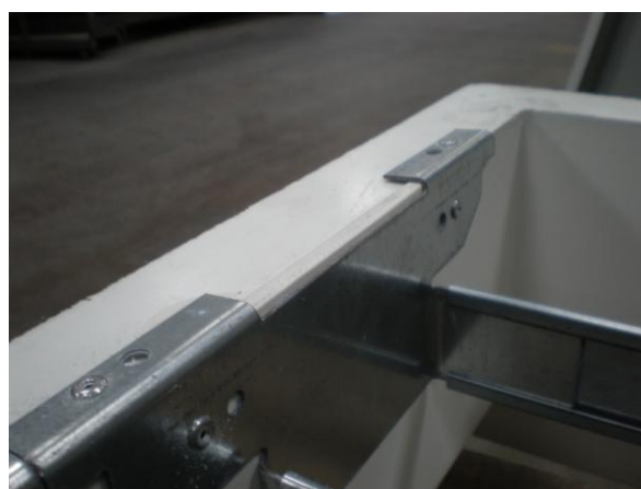
5. Seitenblech mit Kranz verbieten