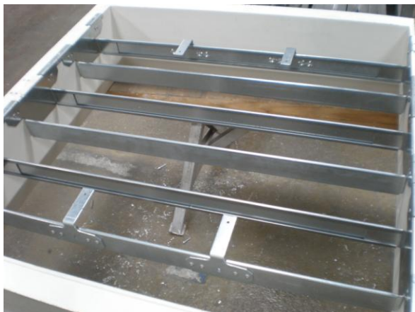
4. Bausätze in Kranz einsetzen